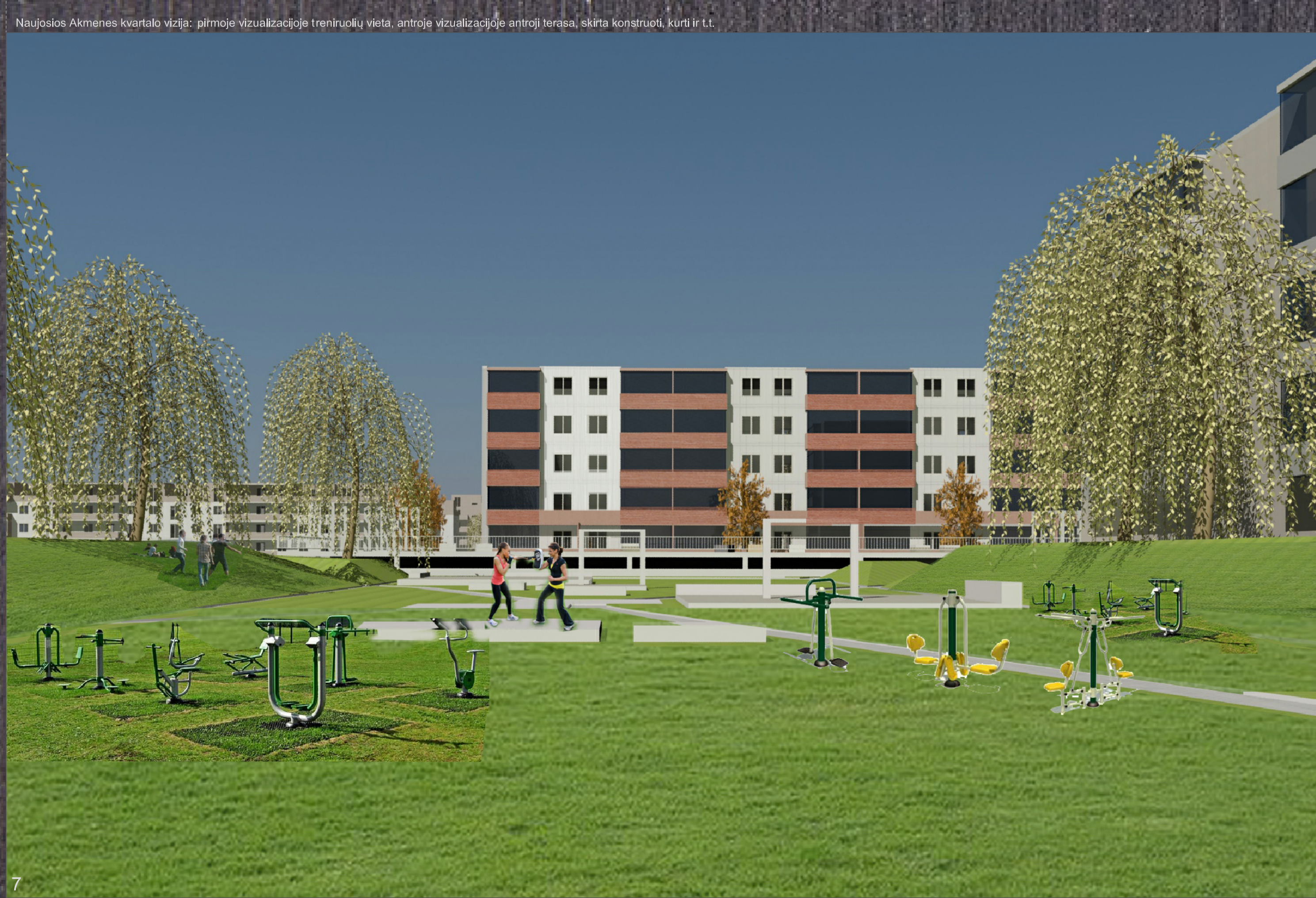
7 Erdvilsas Samuolis VGTU Architektūros fakultetas