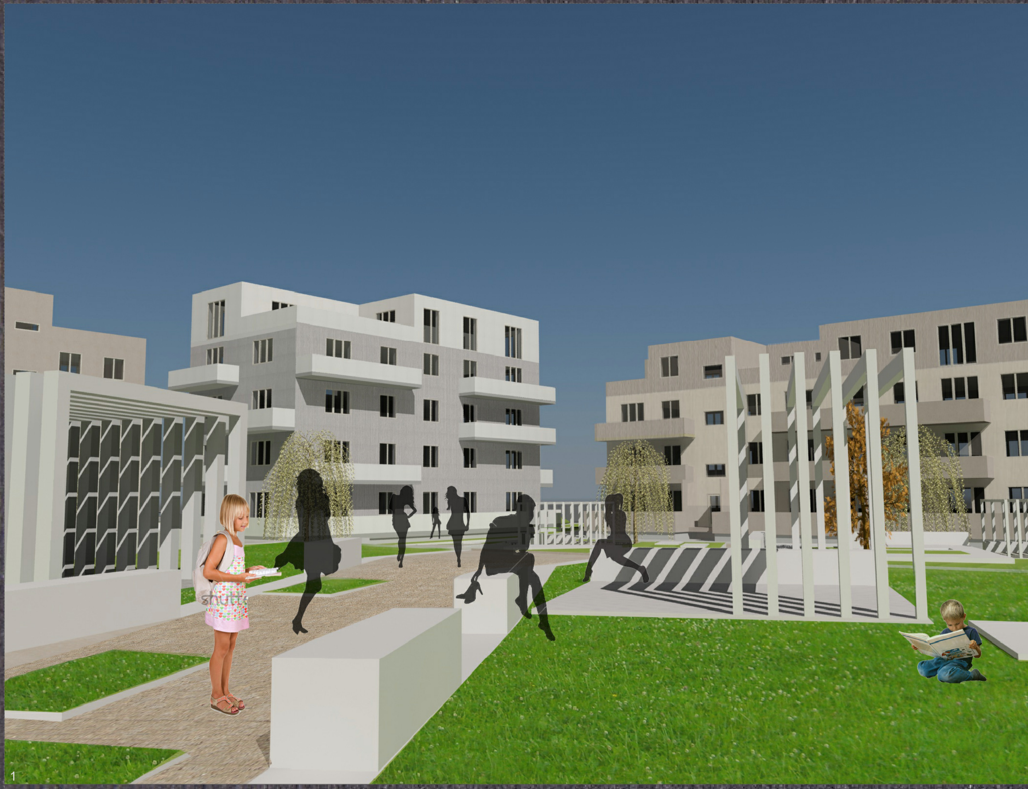
1 Naujosios Akmenės kvartalo vizija, kaip turėtų atrodyti visuomenė po rekonstrukcijos. Aplinka tampa patraukli gyventi, o subjektuos išsiskos oršives, sukurtos poŕiaco zonos, žadinti aktyvumą. Priešdėmas žemėlapis, kuriame surašyti fiktyvūs rakusai, numeris prie vizualizacijos rodo, iš kurio kampo buvo "fotografiuota".