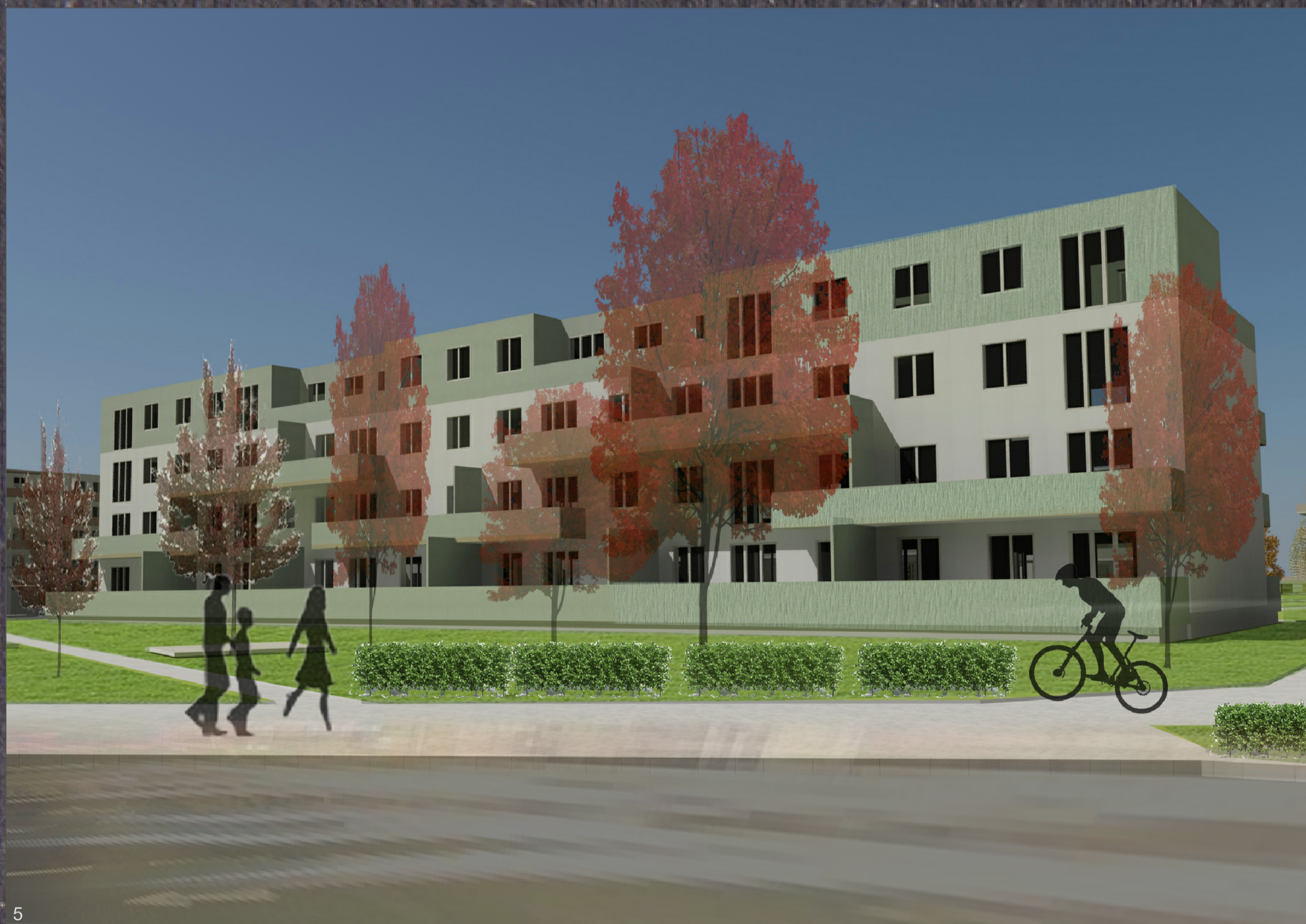
5 Naujosios Akmenės kvartalo vizija: vaizdas nuo V. Kudirkos gatvės