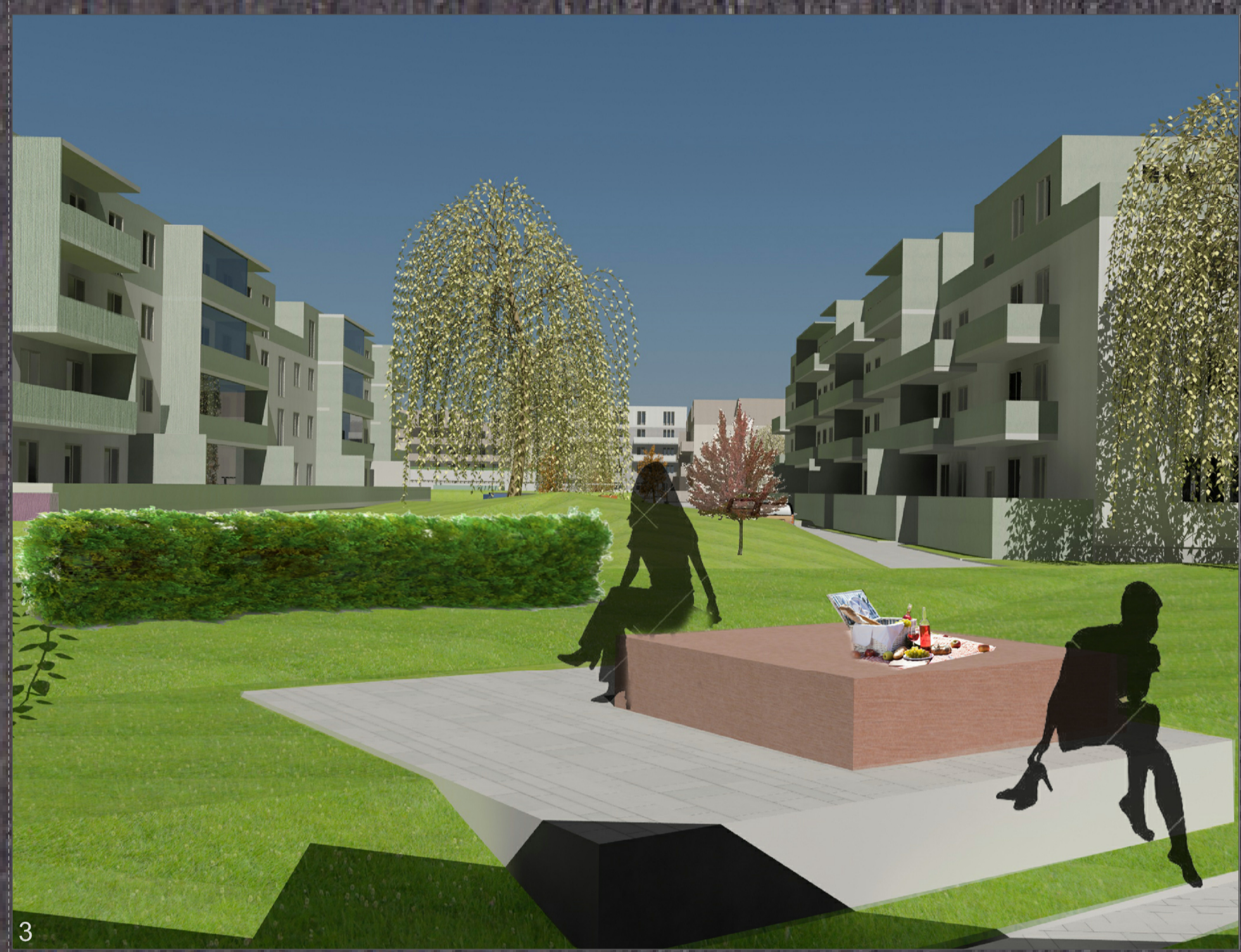
3 Naujosios Akmenės kvartalo vizija: kiemai